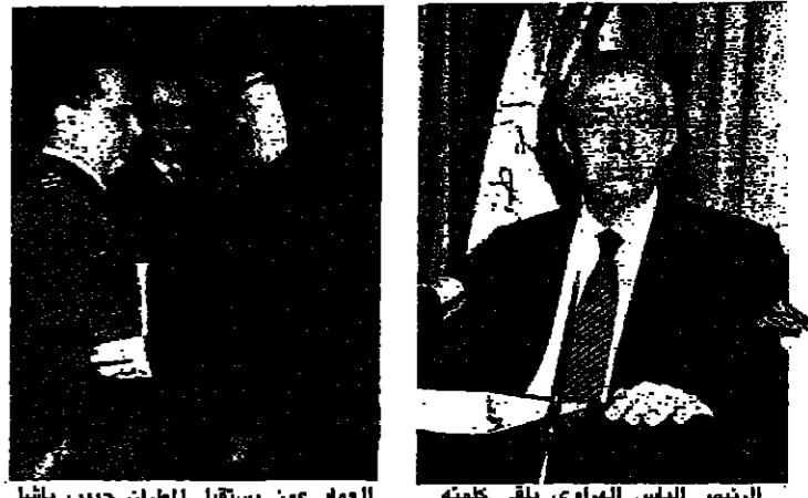
الرئيس اليراققي يلقى كلمته العماد عون يستقبل الطران حبيب باشا

اليوم هو الأخير في روزنامة العام ١٩٨٩. وفيه تتوقف الحركة السياسية. وتتخذ اجازة مله رأس السنة. على ان تبدأ مطلع العام المقبل واعتباراً من اول الاسبوع. دورة جديدة من التحرك من شتى الاتجاهات وسائر المجالات. لاخراج القضية اللبنانية من الجحود الظاهر في المواقف والنواتج المعلنه. والتي اطلقت عليها البورصة السياسية لهذا العام. فيما بقيت البورصة العسكرية متفرجة في اقليم التفاح في الجنوب ولم تفلح المعالجات في لجتها. وكل عام. يتخضع الوضع السياسي. والتوجه الجديد. للسنة المقبلة للرسميين والسياسيين والقياديين. في كلمات ورسائل وخطب الى الحازمين والمهتئين والامة. تعبر عن التمثيات بعام افعل. من دون اغفل التشديد على تحقيق الاهداف التي اعلنوها. خصوصاً تلك التي عثر عنها الرئيس اليراققي في رسالة وجهها الى اللبنانيين امس. والمواقف التي شدد عليها رئيس مجلس الوزراء العماد ميشال عون لدى استقبلته في قصر بعبدا ووفد المهتئين بالعام الجديد من رسميين واداريين وعسكريين.